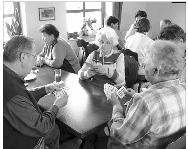
— Anzeige —

D2: 0172/37 13 653 Tel.: 0371/72 00 514 Fax: 0371/72 00 515