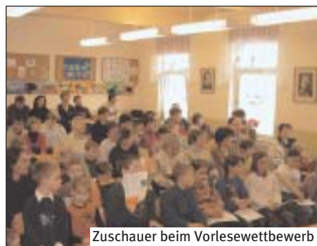
Zuschauer beim Vorlesewettbewerb